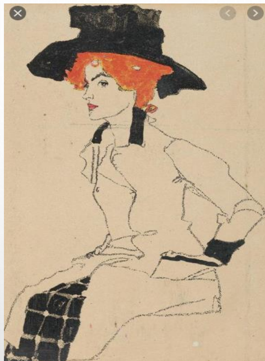
Ritratto di donna (1910)