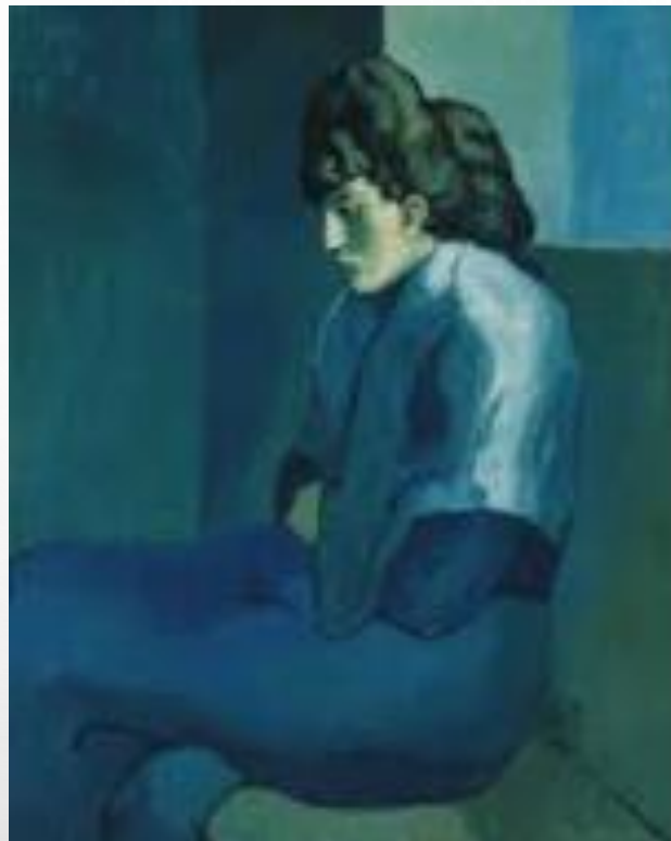
Donna Seduta (1902)