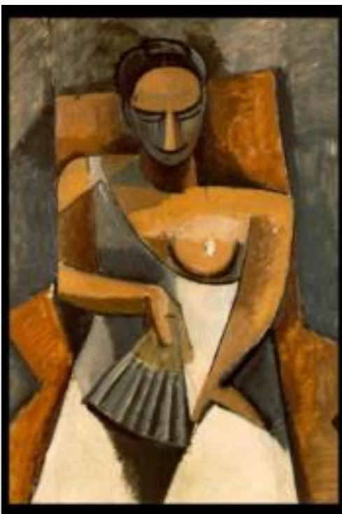
Donna con ventaglio (1907)