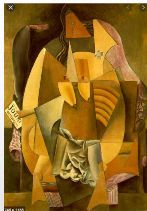
Donna in camicia in poltrona (1913-1914)