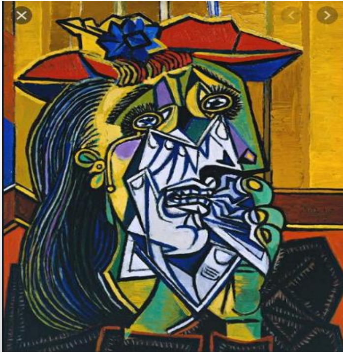
Donna piangente (1937)