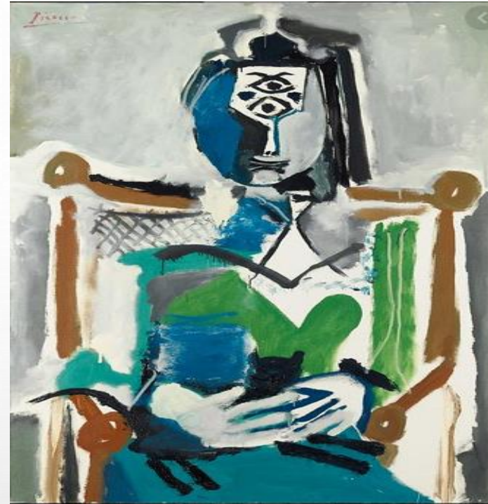
Donna giacente con gatto (1964)