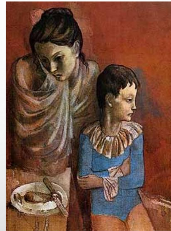
Madre e Figlio (1906)